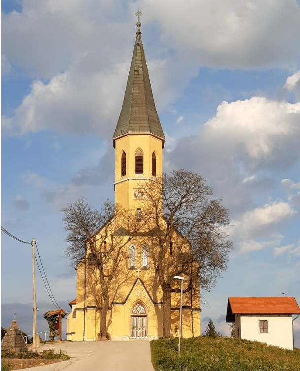
Naš cilj – cerkev Sv. Duha na Velikem Trnu.