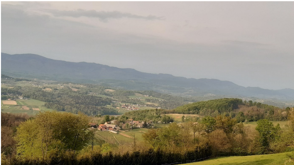
Razgled na vas Lomno in na Štajersko.