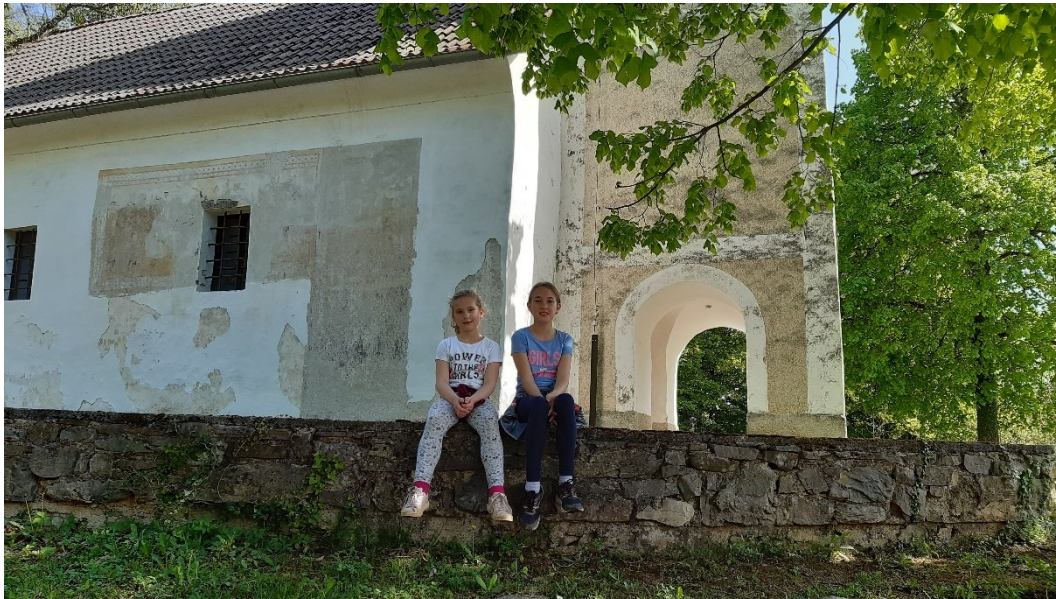
Kratek postanek pri manjši cerkvici v Dalcah pri Lomnem.